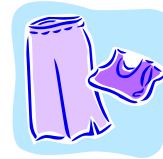
Les magasins préférés des ados