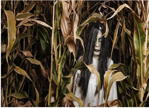
Un zombie qui t'attaque.