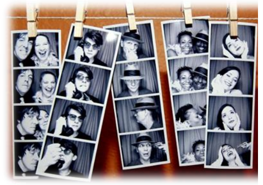
Des personnes qui prend des photos.

Les mitochondries produit l'énergie dans la cellule. Ces montagnes russes extrêmement vite autour du parc.